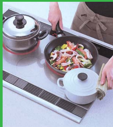
IH キッキング ヒーター